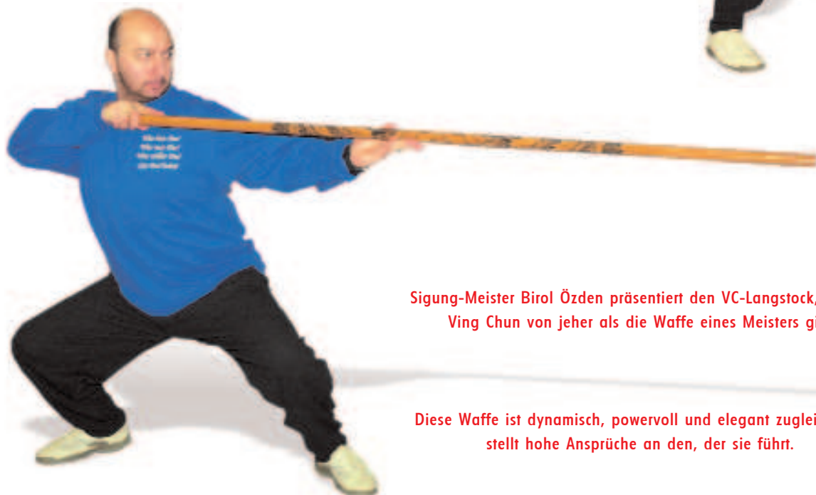
Diese Waffe ist dynamisch, powervoll und elegant zugleich und stellt hohe Ansprüche an den, der sie führt.